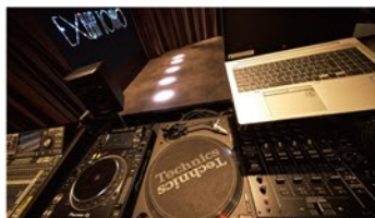
充実の音響・照明・映像設備