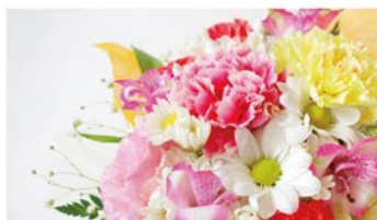
花束・ケーキご用意 ※オプション