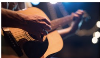
DJ/アーティスト派遣 ※オプション