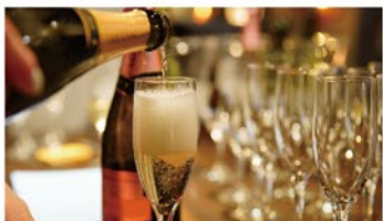
ウェルカムドリンク